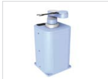
Transfer robot for LCD displays