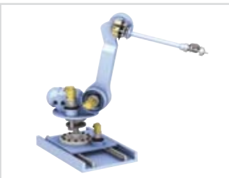
Industrial robot: rotary drive