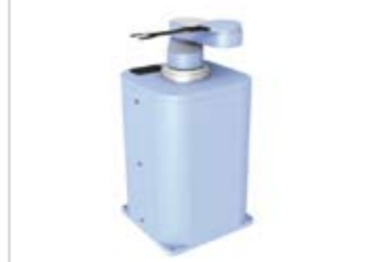
Transferroboter für LCD-Displays