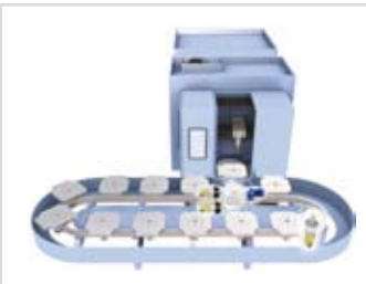
Machine tool: pallet changer